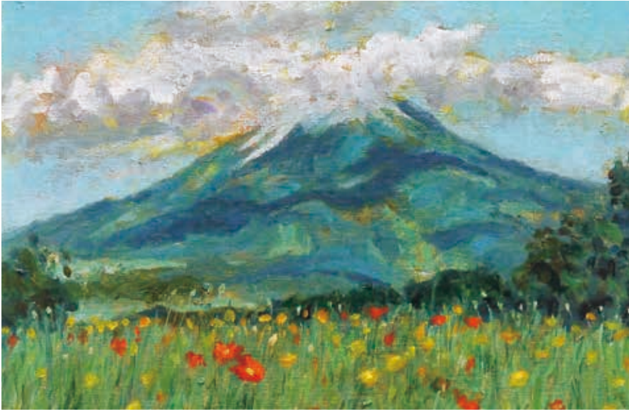
大山 高見 雅博