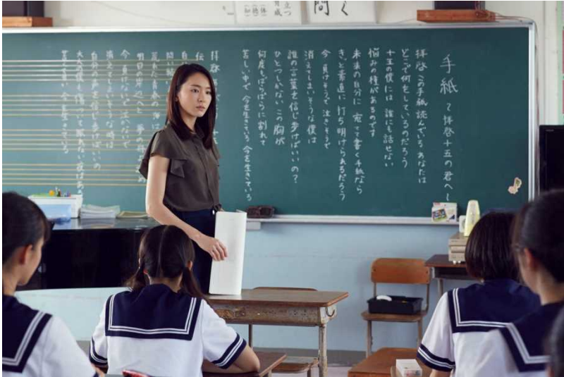
(C) 2015 『くちびるに歌を』制作委員会 (C) ©2011 中田栄一/小学館 【協力 住友商事】

ながさきけん・ごとうれつとう ちゅうがくつう に、てんさいピアニストと うわさ 噂される教師が赴任する。生徒に「15年後の自分」 へ手紙を書く課題を出す教師。その手紙が閉ざしてい た教師の心 を動かしていく・・・