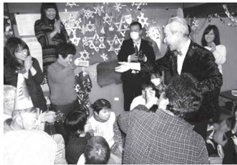
▲クリスマス会でマジックを披露し、大盛況!

平成17年8月にボランティア団体として設立し、「マジックを主体とした楽しい演芸をいつでも貴方のもとへお届けします!」を基本理念に、枚方市内の小学校をはじめ、自治会、高齢者福祉施設などから依頼を受けて活動をしてい