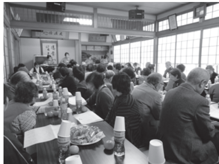
▲大正琴の音色に合わせて歌う参加者

猪熊会長は、「車イスを利用している人にとって不便なところもある事を地域住民が知る良い機会となりました」と話していました。 地域の有志による大正琴の演奏や懐かしい曲に合わせて楽しく歌を歌い、その後、参加者全員で会食をしました。 後半では、ビンゴゲームを行い、景品をもらう姿に会場は大いに盛り上がりました。 参加者からは、「友達ができた」「また、来年も来たい」などと話していました。