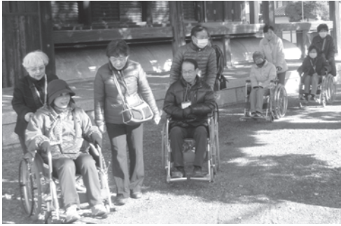
▲砂利道での車イス操作をする参加者

まずは室内にて、車イスの種類や使い方などの基礎的な説明を受けた後、二人一組で屋外に出て実技講習を行いました。