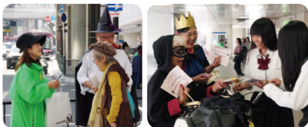
ハロウィーンの仮装で啓発活動

枚方市福祉団体連絡会は、10月31日枚方市駅周辺で障害者週間に先駆け、イベントの案内と啓発活動を行いました。