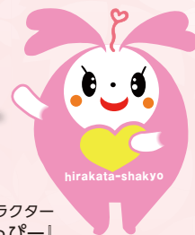
枚方市社協イメージキャラクター 「ひらっぴー」