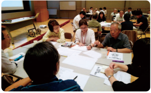
活発な意見が飛び交いました

相談事例 認知症高齢者に関する相談から見えてきたもの CSWが家庭訪問をすると、本人だけでなく、精神障害のある娘と難病の息子、それらに伴う未就労による経済的な困難等、家庭が抱える問題が見えてきました。これをきっかけに家族全体を対象として、必要な支援を進めています。 このケースから学んだことは、認知症高齢者の問題だけでなく、生活困窮やひきこもりなどの隠れた問題があるということです。こうしたことからCSWは生活の状況から問題をキャッチするために相談者の家庭への訪問を大切としています。