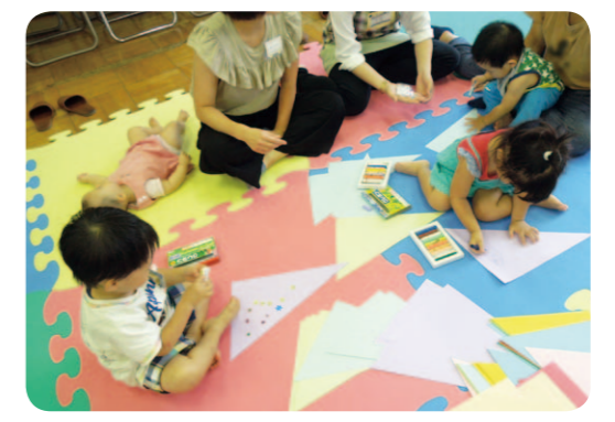
10月の運動会で飾る旗を作っています