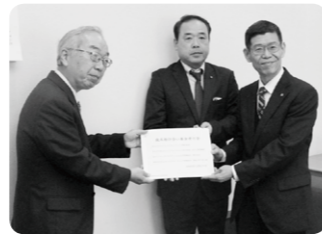
法人として募金活動に取り組む京セラドキュメントソリューションズ(株)

いただいた募金は、ボランティアや福祉団体などへの活動支援や地域での居場所づくりなど、さまざまな福祉活動に活用しています。