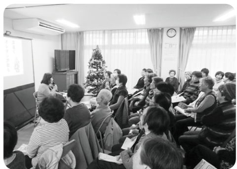
クリスマス会の様子

また、サロンの参加者の中からコーラスグループが結成され、日々練習を重ねています。力強い歌声で、地域の行事などで発表を行うなど、積極的な活動を行っています。