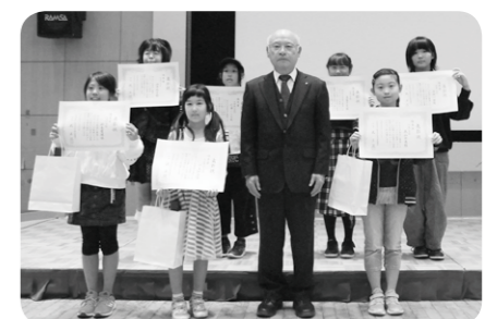
授賞式での記念撮影