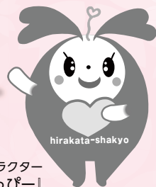
枚方市社協イメージキャラクター 「ひらっぴー」