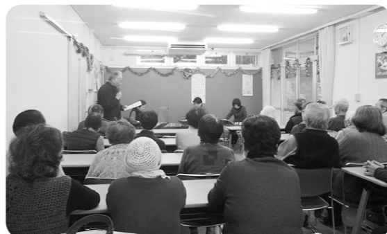
きれいな音色の演奏に聞き入っています

多くの住民が参加し、楽しい気分が過ごせるように、スタッフが毎回さまざまな工夫をこらした取り組みを行っています。ギター演奏を聞いたり、お茶を飲みながらおしゃべりを楽しむほか、クリスマスや新年会など