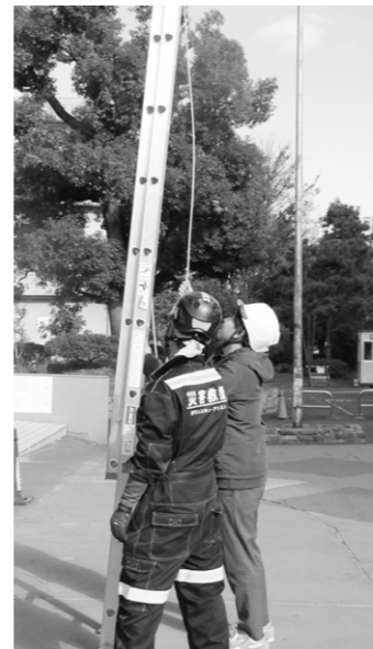
大きなはしごはバランスをとりながら伸縮するのが大変!

バイスを受けながら実践し、サポートに必要な技術を学ぶ事ができました。参加者からは「今まで話を聞くだけの講座が多かったが、今回は実践から学ぶことができたので非常に役にたった」などの感想が寄せられました。枚方市社協では、今後も災害時の支援を強化するための講座を継続的に取り組んでいきます。