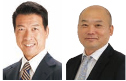
実施副委員長 伏見 隆 枚方市長