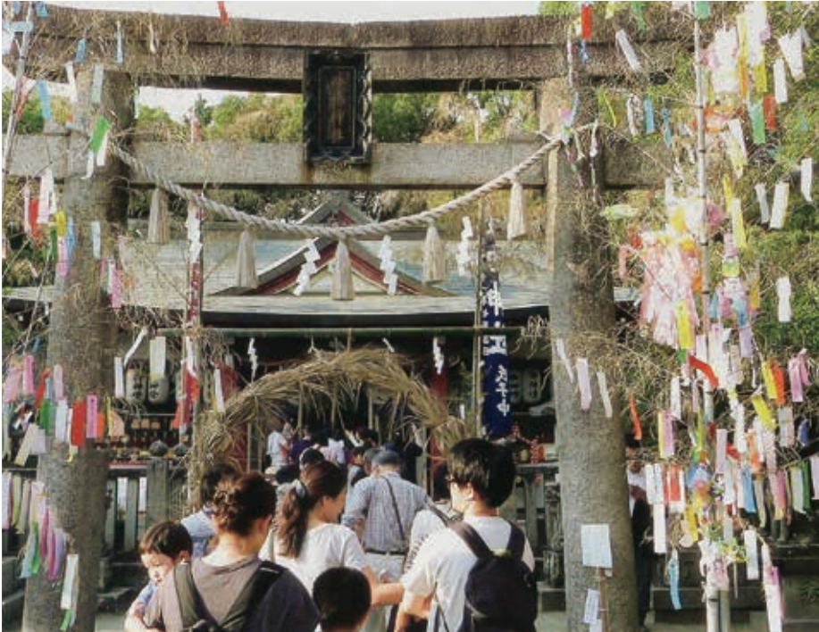
交野市 倉治 機物 (はたもの) 神社 七夕まつり