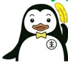
▲更生ペンギンホゴちゃん

「社会を明るくする運動」とは、すべての国民が、犯罪や非行の防止と犯罪や非行をした人たちの更生について理解を深め、それぞれの立場において力を合わせ、安全で安心な明るい地域社会を築くための全国的な運動です。