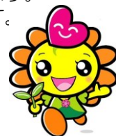
大阪府推進委員会マスコット キャラクターのアカルイーネ

⑦ 受賞作品は報道機関、インターネット、作品集、枚方・交野地区保護司会広報紙「みのり」やホームページに氏名・学校名・学年・作品名や内容を掲載する場合があります。あらかじめ保護者の承諾を得た上で応募をしてください。