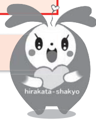
枚方市社協イメージキャラクター ひらっぴー