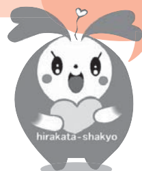
hirakata-shakyo 枚方市社協イメージキャラクター ひらっぴー