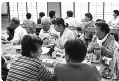
いこいの広場(中部)

枚方市社会福祉協議会 ☎ 807-3448 地域福祉課 FAX 841-0182 枚方人権まちづくり協会 ☎ 844-8866