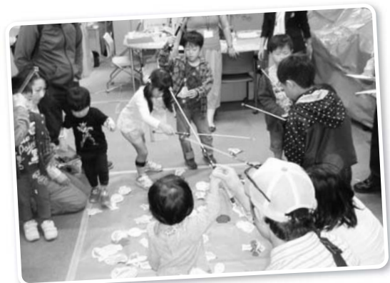
大きな釣り堀で楽しむ子どもたち

また、ボランティアセンターでは魚釣りゲームを実施。待ち時間が出るほどで、「12匹釣れたよ」「もっと、もっと釣りたかった」と、子どもたちの笑顔が広がっていました。