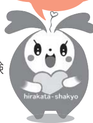
枚方市社協イメージキャラクター ひらっぴー