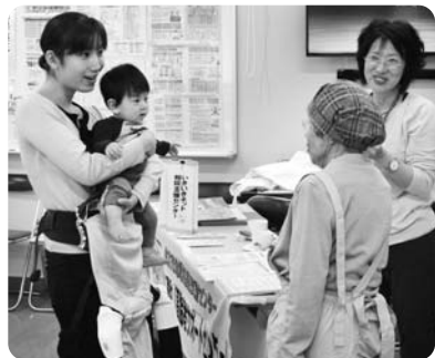
あさみカフェ(北部)

コミュニティソーシャルワーカー(CSW:地域相談員)は、いきいきネット相談支援センターで相談を受けるだけでなく、地域のサロン