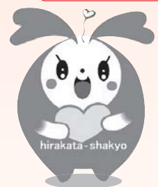
枚方市社協イメージキャラクター ひらっぴー

障害者週間は、障害者の理解を深め、障害者があらゆる分野の活動に積極的に参加していくことを啓発する週間です。障害のある人へのちょっとした配慮を考えてみてください。