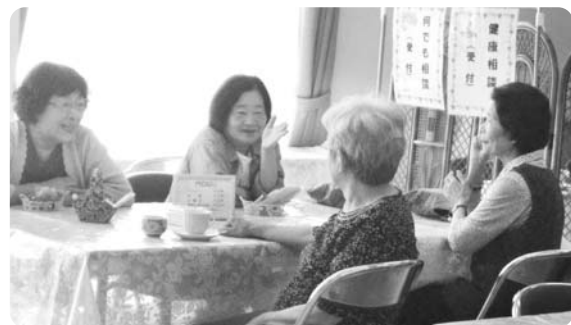
暖かい日差しの中でおしゃべりもはずみず

しゃべりが始まり、ゆったりと時間が過ぎていきました。荒会長は「お茶と楽しい会話の他に専門機関の相談コーナーもおすすです。気軽に声をかけて何でも聞いてみてください」と話していました。