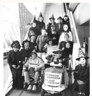
みんなで力を合わせました