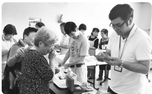
手作りパンは大人気、ランチにどうぞ

買ったパンや家から持ってきたお弁当を食べるなどランチタイムが終わると、「折り紙を折らへん?」との声に、今度は折り紙を手に再びお