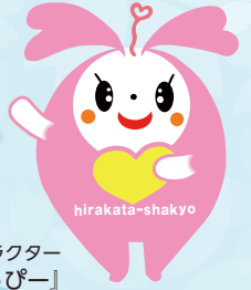
枚方市社協イメージキャラクター 『ひらっぴー』