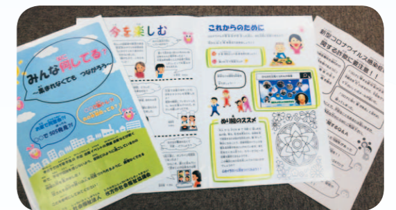
▲新型コロナウイルス感染症の影響による詐欺の情報や自粛中の過ごし方に関するチラシを配布しました。