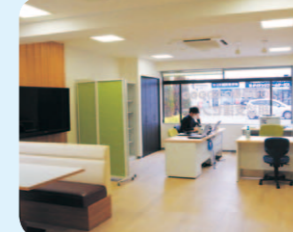
ルファル利用者がみんなが使えます