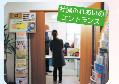
社協ふれあいのエントランス

「地域包括支援センター社協ふれあい」は市内に13か所設置されている地域包括支援センターのひとつです。高齢者のうち要支援の利用者の介護予防プランの作成や、介護・保健・福祉や権利擁護・成年後見・高齢者虐待等の相談に対応します。