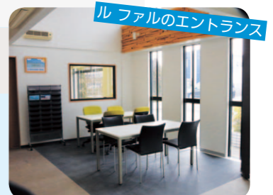
ルファルのエントランス

「いきいきネット相談支援センター」は困ったときに気軽に相談できる「ふくしの総合窓口」として、CSW（コミュニティソーシャルワーカー）を配置します。他にも、いろいろな福祉活動を支援するための場としても機能します。