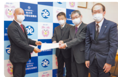
法人として募金活動に取り組む京セラドキュメントソリューションズ(株)

集められた募金は、ボランティアや福祉団体などへの活動支援や地域での居場所づくりなど、さまざまな福祉活動に活用されます。