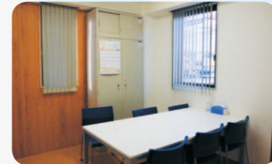
カンファレンス兼相談スペース