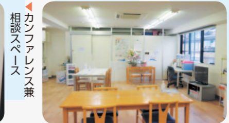
地域活動スペース

③グループホーム運営事業 枚方市社協が運営する4か所のグループホームの管理・運営。