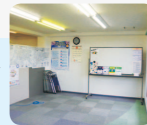
ミーティング・相談スペース